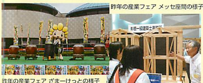
昨年の産業フェア ざまーけっとの様子

今年で第4回目となる産業フェアは昨年同様、ハーモニーホール座間の小ホールでは工業系のメッセ座間、ふれあい広場では商業系のざまーけっとを同時開催。メッセ座間ではコマ対戦を始め、匠の技や自社製品のPR等を展開する。ざまーけっとでは野菜詰め放題や2日間限定のスペシャル弁当の販売等を企画。他にも会場内には様々なブースがあり、座間市内の商工業を身近に感じられるイベントの開催を予定しております。