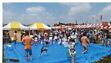
逃げる鮎を追いかけける子供たち

昨年に続き2度目の開催になりましたが、昨年の倍の方々にご参加いただき、大盛況のうちに終了しました。