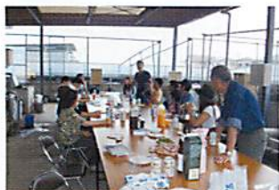
「バーベキュー大会」