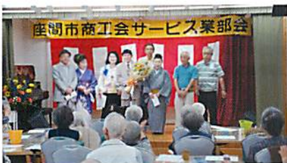
部会長と出演者が勢揃い