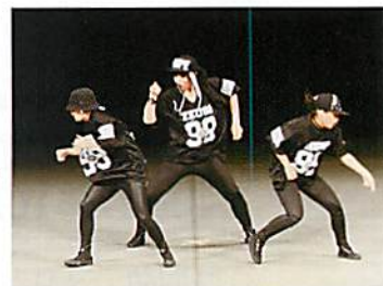
昨年の優勝チーム

11月1日（日）市民ふるさとまつりにて「Street Dance Contest in ZAMA 2015」をハーモニーホール座間 大ホールにて開催します。今年もざまりんとキッズダンサーズによるダンスを披露します。昨年よりもさらにパワーアップしたダンスをぜひご覧ください。多くの皆様のご来場をお待ちしております。