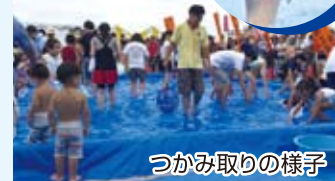
つかみ取りの様子