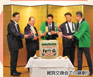
賀詞交換会での鏡割り