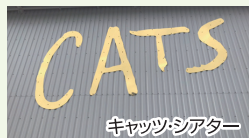
キャッツシアター

入谷支部では、10月6日(日)に支部会員の福利厚生事業として、劇団四季CATS鑑賞ツアーを開催いたしました。当日は多くの支部会員の方々にご参加いただきました。ツアー中は終始和やかな雰囲気の中で交流を深めることができ、有意義な福利厚生事業となりました。