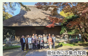
能仁寺にて集合写真

栗原支部では、11月19日(火)に日帰りバス旅行を実施しました。午前中に紅葉の名所「平林寺」の見学を行い、小江戸「川越」にて昼食をいただき、蔵造りの街並みを散策しました。午後には、「能仁寺」にて百名園のひとつの庭園を散策しました。最後に、サイボクハムにて沢山のお土産を購入して、無事帰路につきました。