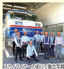
スカイライナーの前にて集合写真

工業部会では、座間工業会と合同で11月 1日(金)～2日(土)に千葉県にある京成車 両工業(株)にて、整備工場を視察しました。 安心・安全かつ正確で快適な運行のため品 質の高い整備を行う検査体制について説 明を受けました。また、(株)旭鷲にて、天保元 年創業の歴史ある酒造店の製造工程を見 学し、有意義な視察研修となりました。