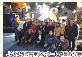
JAXA筑波宇宙センターにて集合写真

相武台支部は11月23日(土・祝日)に26名で茨城方面へ行ってきました。相武台を出発し「牛久大仏」「JAXA筑波宇宙センター」等を見学し、午後は「伝統的建物群保存地区でもある真壁町」で、現地のボランティアガイドと町並を散策。その後、「道の駅しもつま」に立ち寄り、無事相武台に帰着いたしました。当日は朝から生憎の雨模様でしたが、ツアー中は終始和やかな雰囲気の中で交流を図ることができとても有意義な会員交流事業となりました。