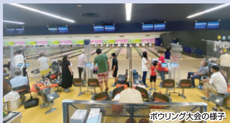
ボウリング大会の様子