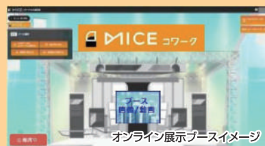
オンライン展示ブースイメージ

ス内で製品紹介や施工事例等の紹介を行います。アクセス方法などについては後日、商工会ホームページ内でお知らせいたしますので是非皆さまのご来場をお待ちしております。