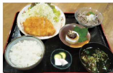
〈コースかつ定食〉ランチ 900円