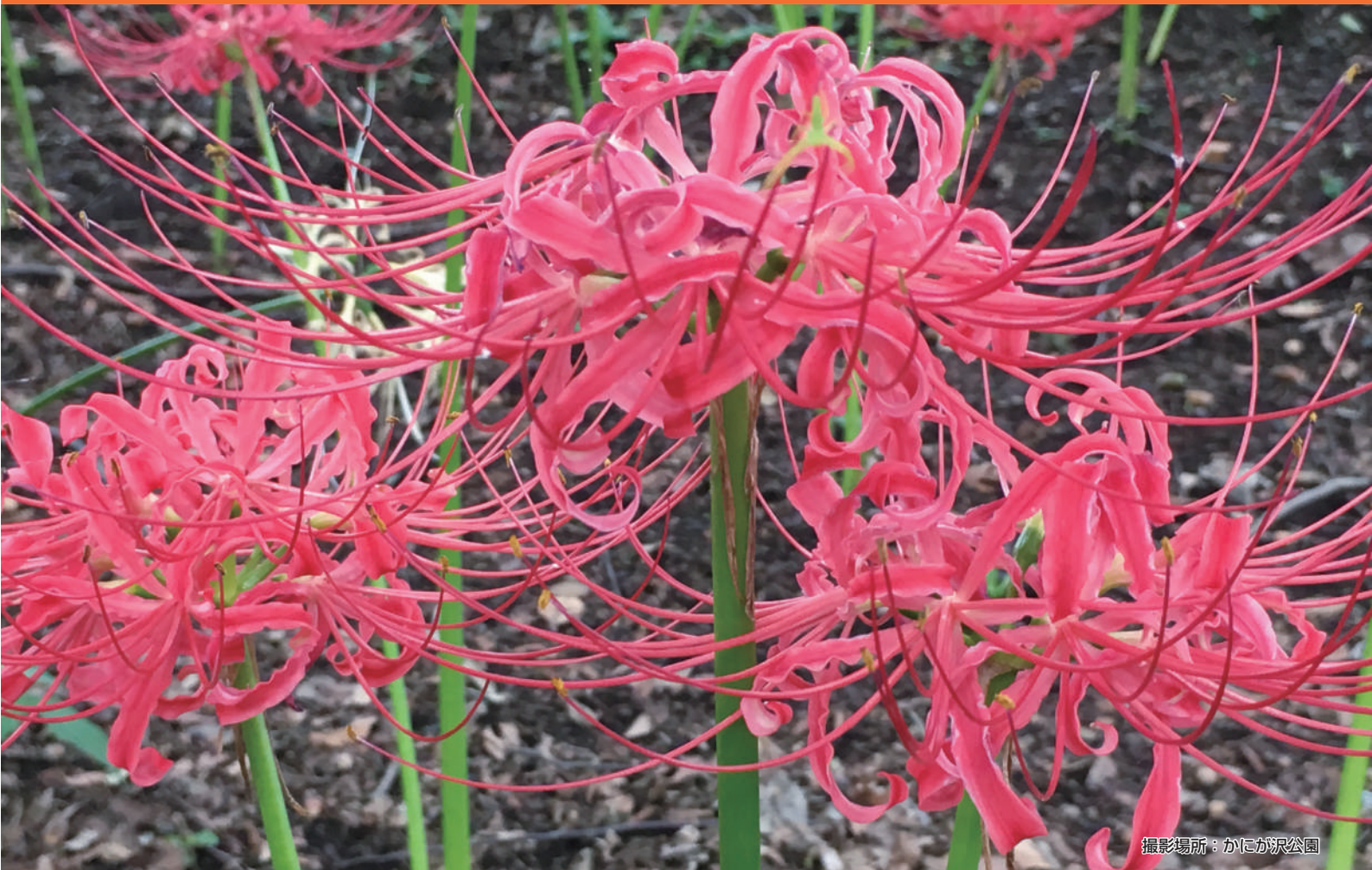
撮影場所：かにが沢公園

※「いさま」の由来は、奈良時代の「続日本記」や平安時代の「和名類聚鈔」にある座間の古称・夷参です。