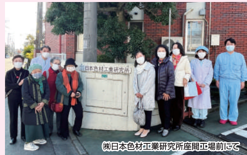
(株)日本色材工業研究所座間工場前にて

また視察研修会終了後、春駒にて部員交流事業を開催。新型コロナウイルス感染対策を講じての開催となりましたが部員間の交流を図ることができ有意義な時間を過ごすことができました。