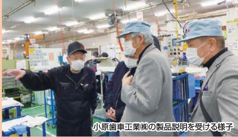
小原歯車工業(株)の製品説明を受ける様子

工業部会では、座間工業会と合同で令和3年12月17日(金)～18日(土)に埼玉県川口市にある小原歯車工業(株)にて、工業用歯車の日本トップシェアを誇る製造現場及び品質管理体制・生産管理体制を見学し、その後の質疑応答では、人材確保や工場の清掃を含めた5Sの取組みなどについて伺い、有意義な視察研修となりました。また、視察研修終了後に新型コロナウイルス感染対策を講じて懇親会を開催し、意見交換を行いました。