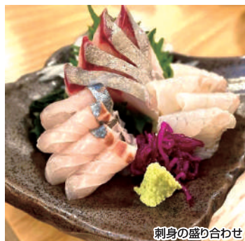
刺身の盛り合わせ