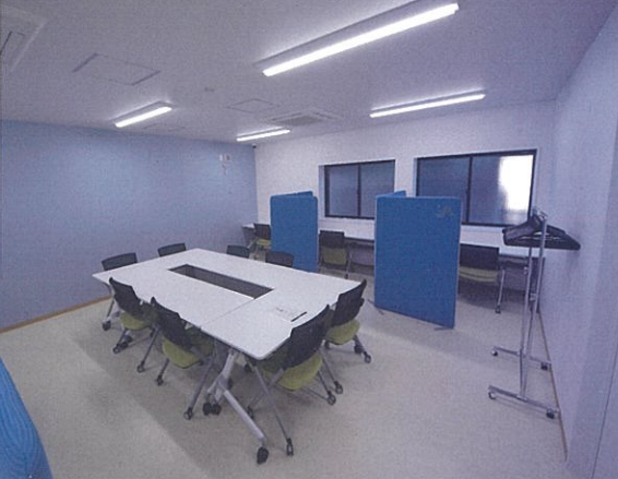
フリースペース(入口から)