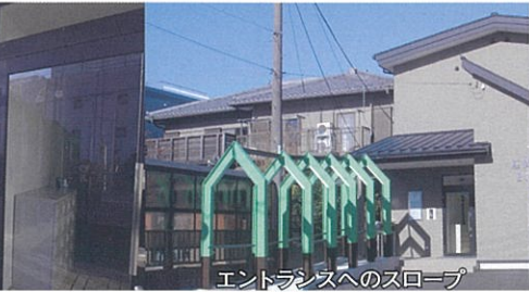
エントランスへのスロープ