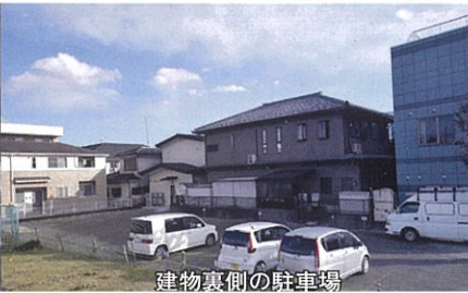
建物裏側の駐車場