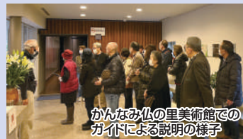
かんなみ仏の里美術館でのガイドによる説明の様子

午前は、修善寺周辺を散策後、中伊豆にあるワイナリー工場へ。昼食後は、めんたいパークとかんなみ仏の里美術館に足を運びました。道中は雨模様とはなりましたが、山々にかかる雲海等、雨の日ならではの景色もバス車内から見ることができ、とても楽しく有意義な時間を過ごすことができました。