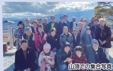
山頂での集合写真

手指消毒などの感染対策を図りながらの開催となりましたが、終始和やかな雰囲気の中で交流を図ることができ、有意義な事業となりました。