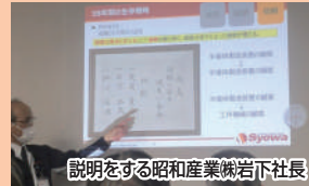
説明をする昭和産業岩下社長

また、19日(土)は、マルス穂坂ワイナリーにて醸造所を見学し、有意義な視察研修となりました。