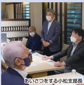
あいさつをする小松支部長

当日は21名に参加いただき、支部事業についての意見交換を行い、和やかな雰囲気での交流することができました。