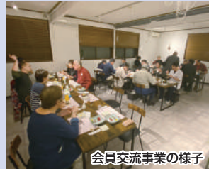
会員交流事業の様子