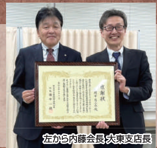
左から内藤会長 大東支店長

マル経融資とは、昭和48年10月から商工会・商工会議所などの経営指導を金融面から補完し小規模事業者の経営改善を促進する目的として創設された、無担保・無保証人で利用できる融資制度です。