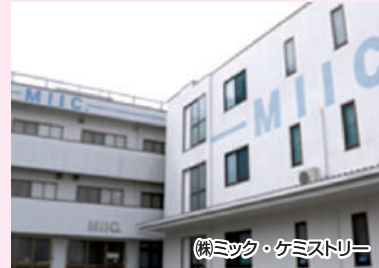
(株)ミック・ケミストリー